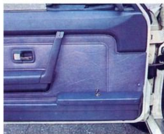
Auf Wunsch abschließbare Türablage

Wie taxi heute in dem Gespräch erfuhr, waren Anfang des Jahres, und möglicherweise durch unseren Praxisvergleichstest in Heft 1/79 ausgelöst (18 mal gut und sehr gut für den Audi 100), die Taxizulassungen des Audi 100 merklich in die Höhe geschneit. Sie haben sich im ersten Halbjahr 1979 gegenüber dem Vorjahr mehr als