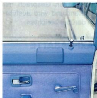
Gut erreichbare große Aschenbecher