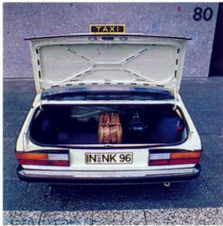
80 Großer Kofferraum des Audi 100

führt. Ergänzt wird das Service-Angebot durch den V.A.G. Notdienst, der an Wochenenden und Feiertagen zu bestimmten Zeiten aufrechterhalten wird. Die Notdienst-Zentrale in Wolfsburg, Tel. 05361/225050, nennt dienstbereite Betriebe.