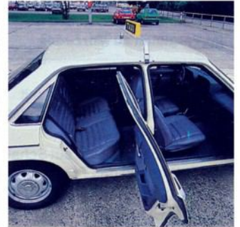
Gute Einstiegs-Möglichkeit beim Audi 100

Sollten Sie Interesse an einer derartigen Besichtigung haben, setzen Sie sich bitte mit der Redaktion von taxi heute oder Ihrem Verband in Verbindung.